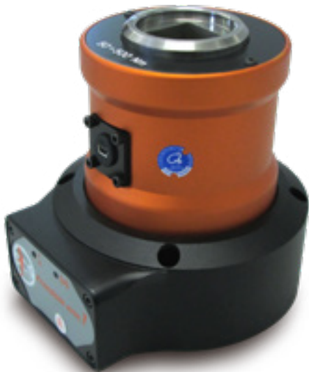
Przetworniki Statyczne momentu obrotowego z połączeniem Bluetooth