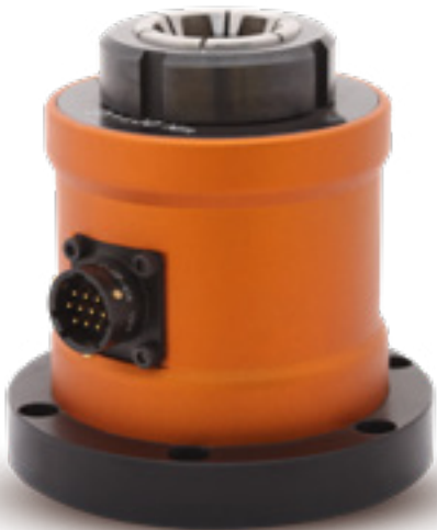
Przetworniki statyczne momentu obrotowego z połączeniem kablowym dla hydraulicznych narzędzi impulsowych