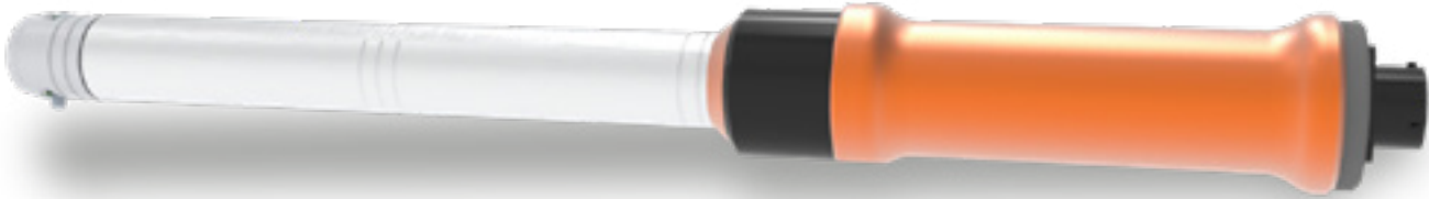
FWE - Klucz dynamometryczny z pomiarem momentu do analizatora DataTouch 3