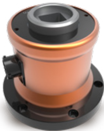
Przetworniki statyczne momentu obrotowego z połączeniem kablowym