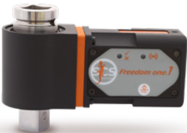
RMC Obrotowe przetworniki - moment Bluetooth