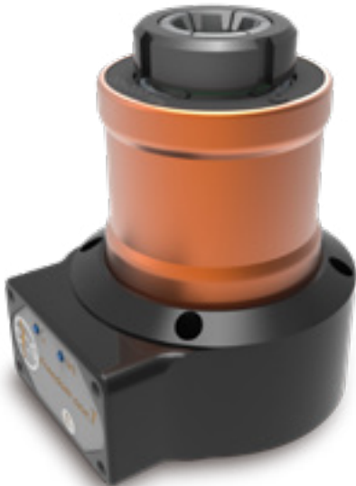
Przetworniki Statyczne momentu obrotowego z połączeniem Bluetooth dla hydraulicznych narzędzi impulsowych