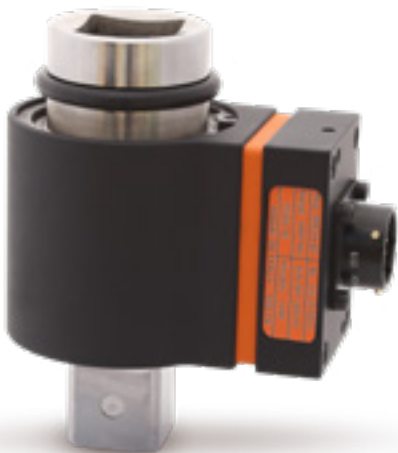
RMC Obrotowe przetworniki - moment