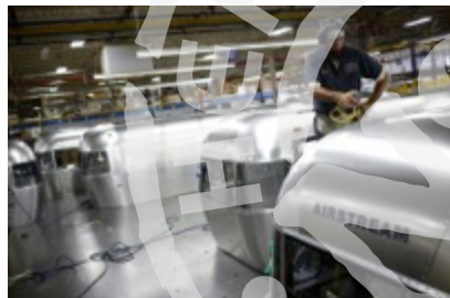
Produkcja pojazdów rekreacyjnych, naczep i przyczep kempingowych