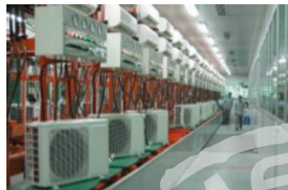
Wytwarzanie pomp i urządzeń do systemów ciepłych i wentylacyjnych