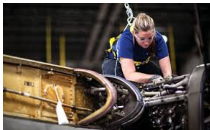
Konserwacja, naprawy i obsługa techniczna