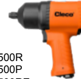
CWC-500R CWC-500P CWC-500RE CWC-500PE