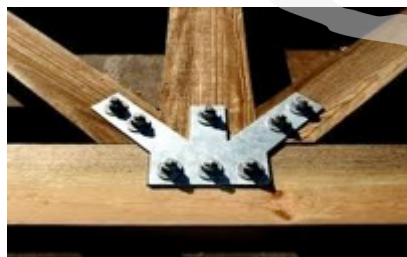
Meble i wyroby z drewna