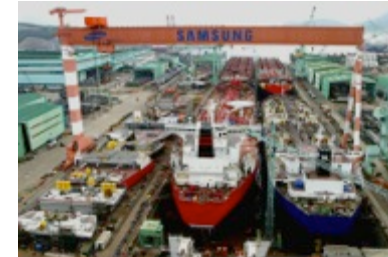
Przemysł stoczniowy i morski